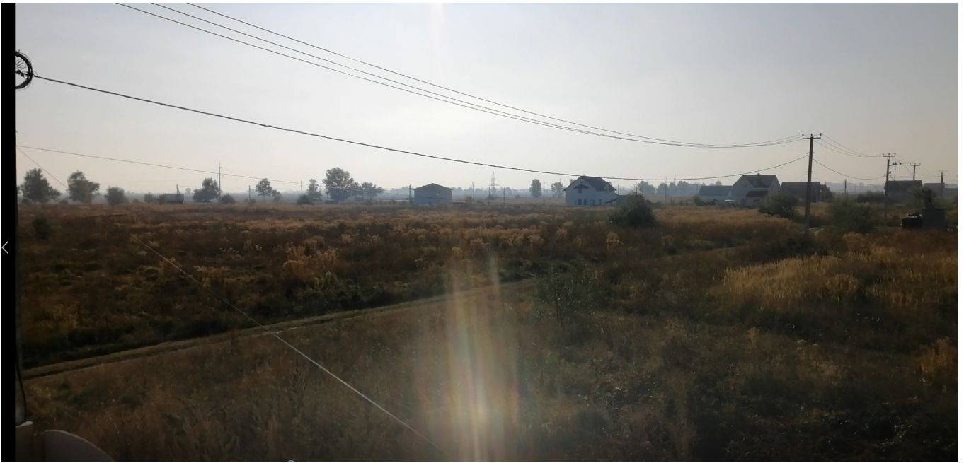
Udsigten fra vores hus

Jeg har nu boet næsten 6 år i Ukraine, og meget er ændret, siden jeg kom under revolutionen i Februar 2014.