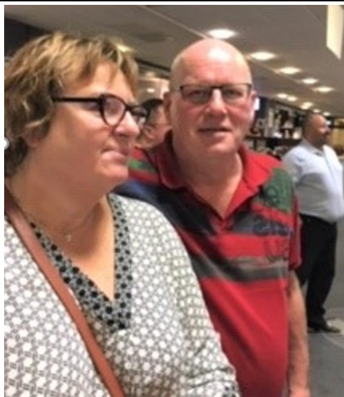
Formand og redaktør i alvorlig samtale - Men om hvad?