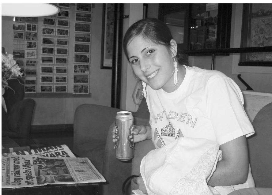
»Her er jeg i færd med det jeg gør bedst. Ej, jeg er på vej til koncert. Jeg var i Stockholm for at høre Stevie Wonder.«