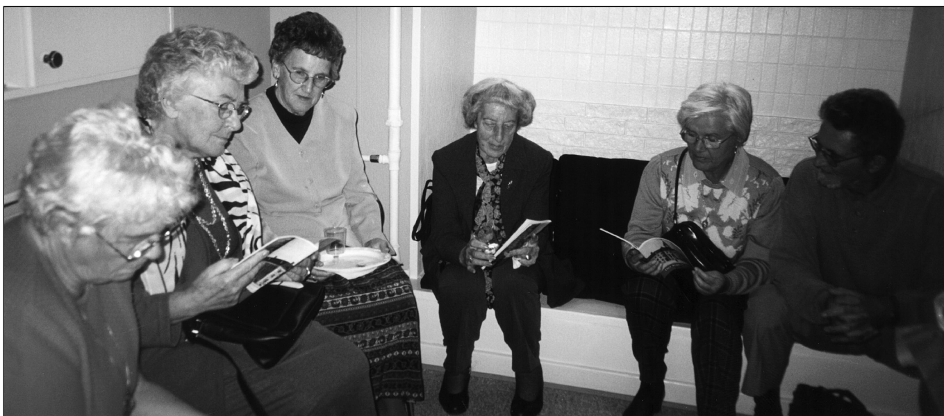
Et udsnit af de 50 gæster. Vajsenhusets årsskrift gennemgås omhyggeligt.

Ved de festlige smykkede borde, hvor menukortet og musikprogrammet skjultes i en fiks kopi af det nye banner, der vajede ved hver kuvert, fortsattes nu festen, og taler og sange vekslede i en endeløs række."